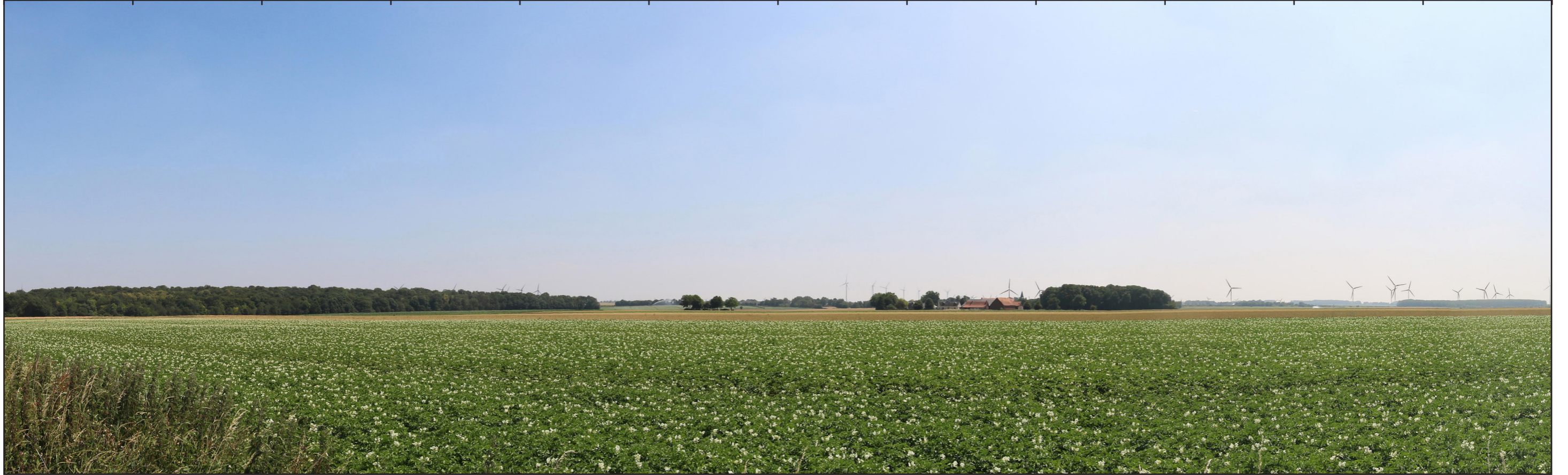
ETAT INITIAL - VUE PANORAMIQUE