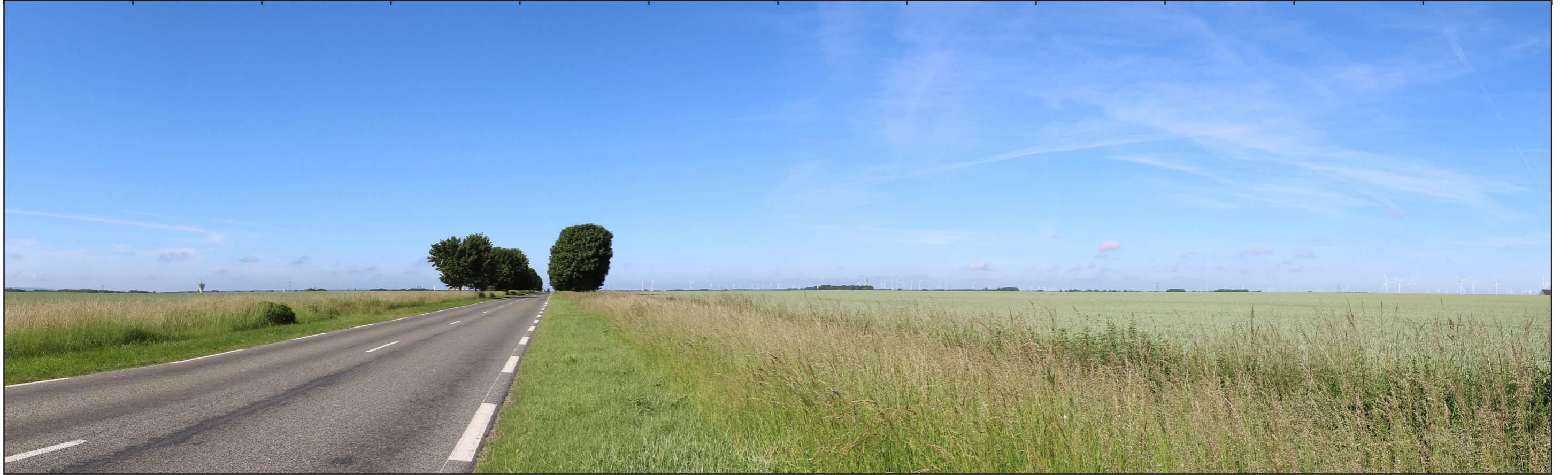
ETAT INITIAL - VUE PANORAMIQUE