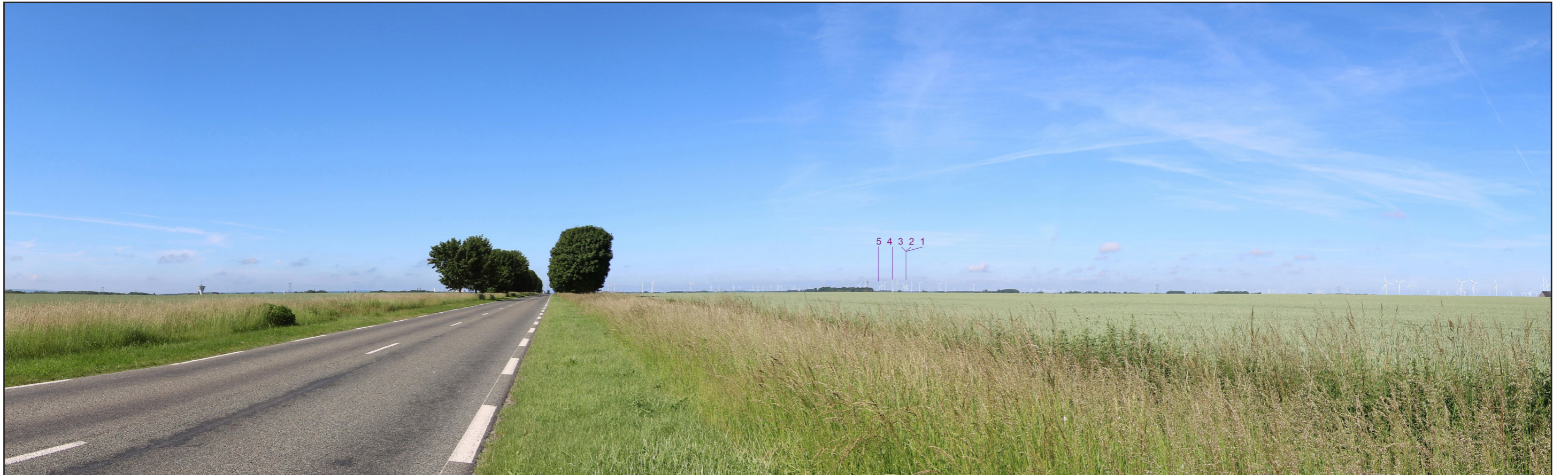
PHOTOMONTAGE DU PROJET ÉOLIEN - VUE PANORAMIQUE