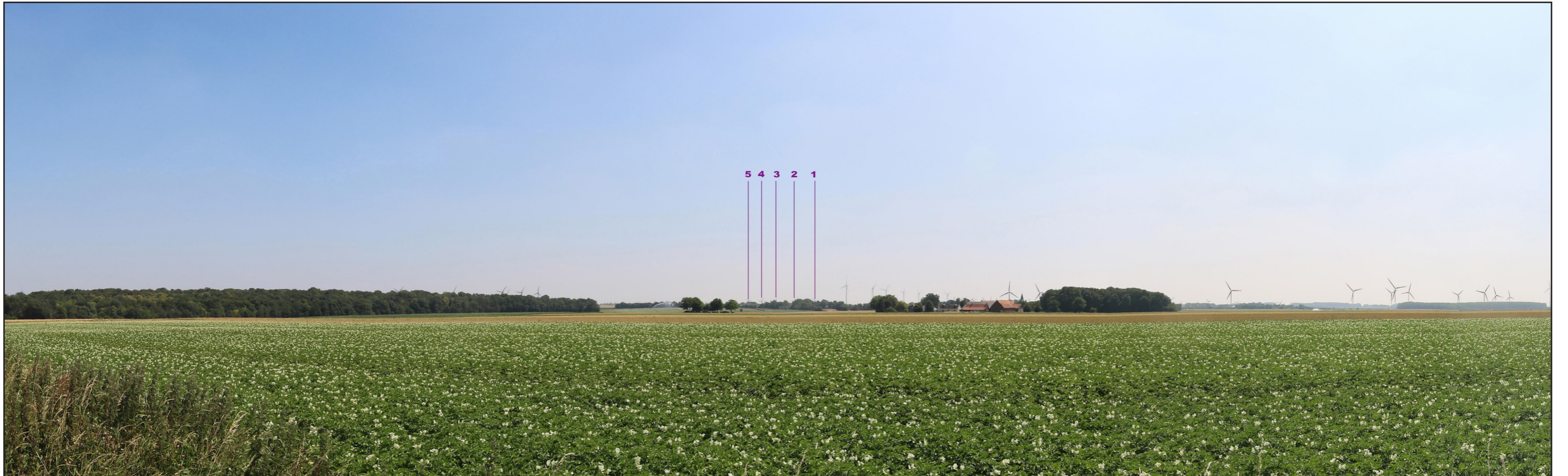
PHOTOMONTAGE DU PROJET ÉOLIEN - VUE PANORAMIQUE